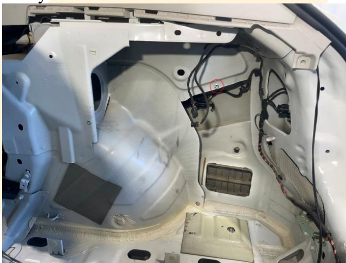
Рисунок – 1