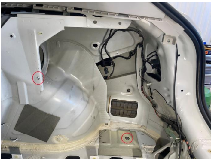
Рисунок – 2