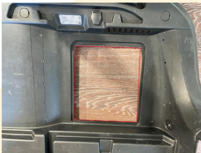
Рисунок – 3