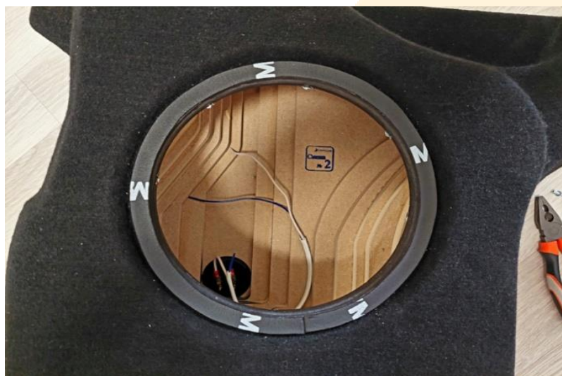
Рисунок – 5

Примечание: при установке сабвуфера необходимо монтажное отверстие проклеить уплотнителем идущем в комплекте (см.рисунок 5).